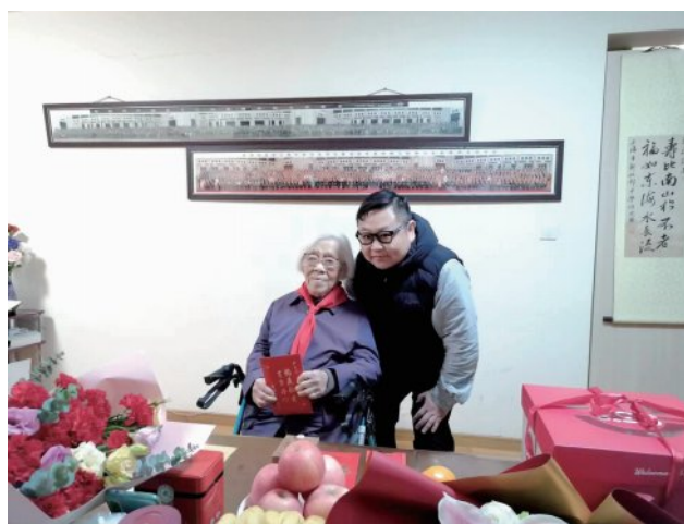
图文 / 机电公司 陈平