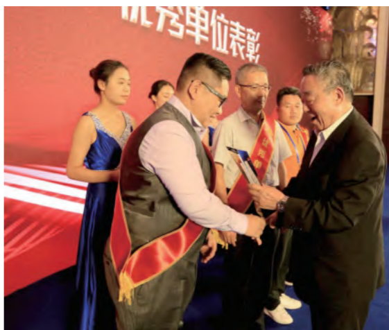
上海市建设工程“白玉兰”奖优秀单位