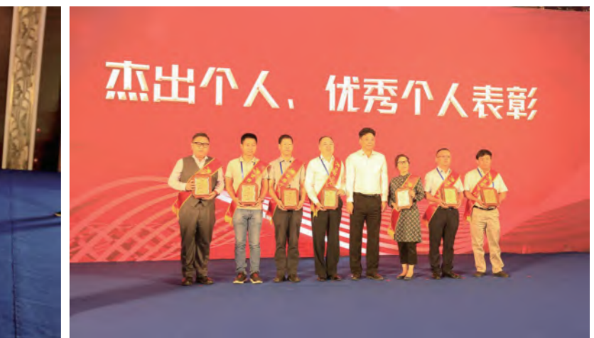
上海市建设工程“白玉兰”奖优秀个人