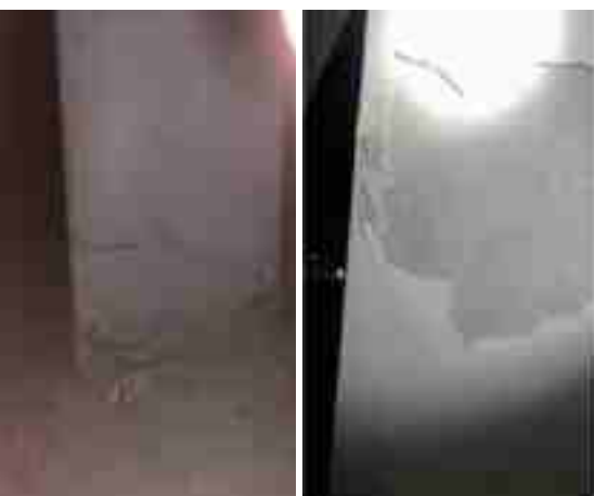
结构上浮柱体底部开裂破坏结构上浮柱体顶部开裂破坏

近年来,在主体结构施工阶段,由于地下水位上升,对结构产生的浮力超出结构承载能力,导致地下室结构破坏的事件时有发生,给结构使用的安全性带来一定隐患,同时也带来不同层次的经济损失和社会影响。在结构施工阶段怎样做好地下室结构由于浮力影响导致结构破坏的措施显得尤为重要,地下室结构上浮危害可归纳成以下几个方面。