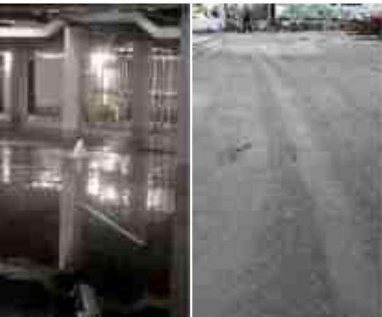
底板上浮不平整顶板上浮产生开裂